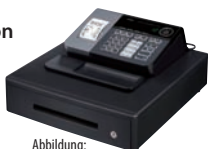
Abbildung: Modell mit großer Schublade.