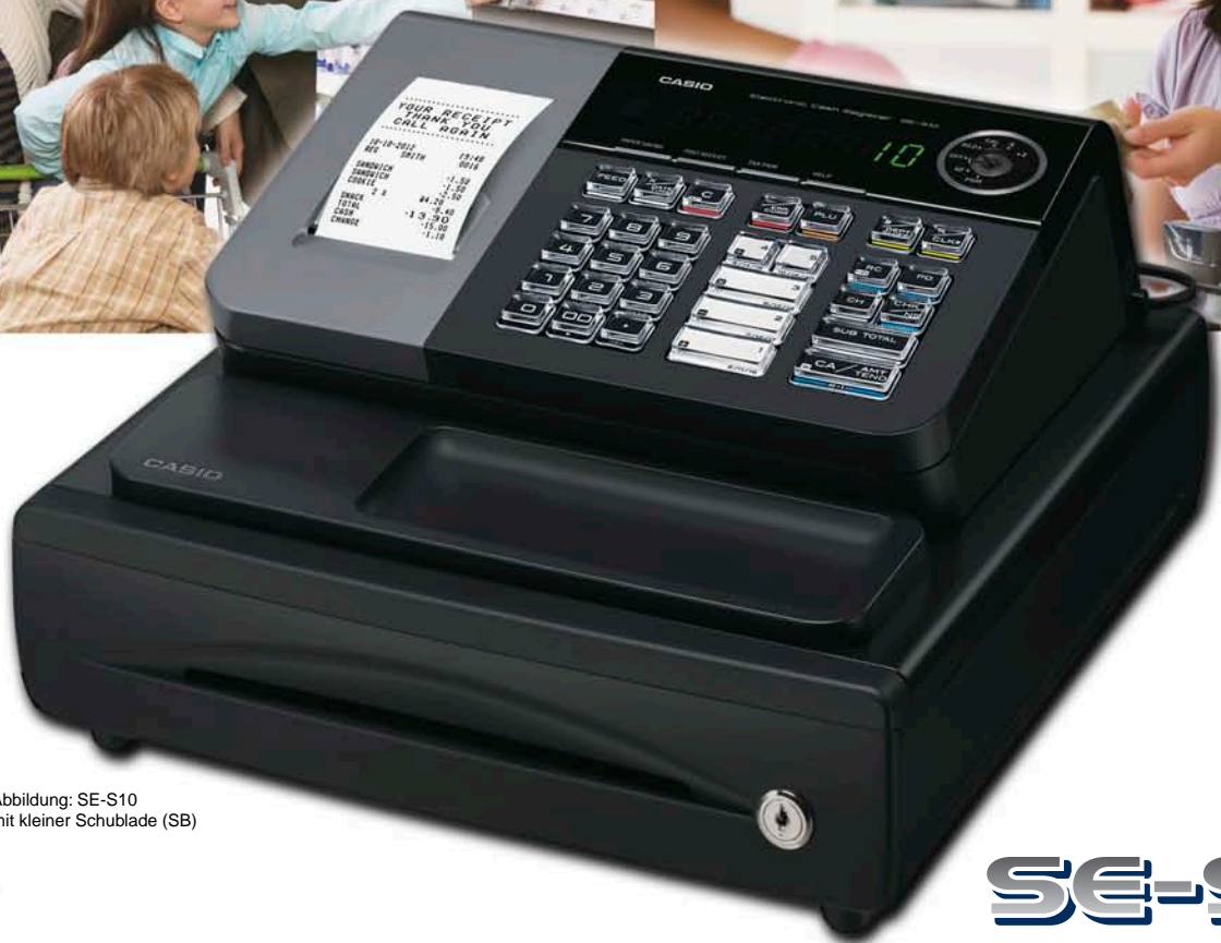
Abbildung: SE-S10 mit kleiner Schublade (SB)